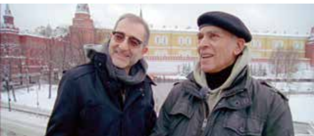
Iraqi Odyssey Samirs Odyssee der besonderen Art! Optimistisch und fesselnd!

ICH BIN DANN MAL WEG – gerade beim Jahreswechsel überkommt manchen eine metaphysische Sehnsucht, der Wunsch nach innerer Neusortierung. Wer dazu nicht die Beschwerlichkeiten des Jakobswegs auf sich nehmen möchte, linst einfach Hape Kerkeling bzw. dessen Alter Ego Devid Striesow über den Rucksack. Auf ganz andere Weise neu sortieren muss sich Einar, als er Gattin Gerda in Frauenkleidern Modell steht und dabei Lili, THE DANISH GIRL , in sich entdeckt. Leonardo DiCaprio will in THE REVENANT mitnichten weg, im Gegenteil: Mit ungeheuerlichen Verletzungen begibt er sich kriechend auf den Rückweg aus der amerikanischen Wildnis – angetrieben vom Durst nach Rache. Ob die 27-jährige Janis Joplin so wegwollte, wie es die 1970 genommene Überdosis Heroin nahelegt, oder ob sie darin verloren ging, können wir sie nicht fragen. Fast alles andere klärt die Künstlerbiographie JANNIS: LITTLE GIRL BLUE . Verloren sein in einer verworrenen Welt, die das Besondere nicht achtet, die-